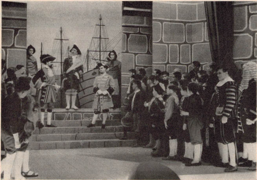
«Zar und Zimmermann»: Schlußszene

Brünig nach Spiez und mit der verbilligten Lötschberg-Simplonbahn nach Domodossola und Locarno und durch den Gotthard zurück ermöglichte.